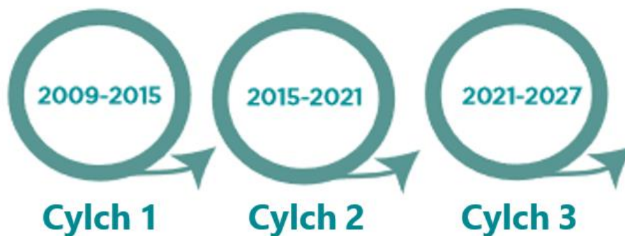
Ffigur 1. Diagram cynllunio sy'n dangos y cyfnodau amser a gwmpesir gan bob cylch rheoli basn afon.

Llunnir hwn, Cynllun Rheoli Basn Afonydd Gorllewin Cymru y trydydd cylch, gan Cyfoeth Naturiol Cymru o dan Reoliadau'r Amgylchedd Dŵr (Y Gyfarwydddeb Fframwaith Dŵr) (Cymru a Lloegr) 2017. Mae Llywodraeth Cymru, fel yr awdurdod priodol ar gyfer ardaloedd basn afon sydd wedi'u lleoli yng Nghymru yn gyfan gwbl, a'r rhannau o ardaloedd basn afon trawsffiniol sydd wedi'u lleoli yng Nghymru, wedi darparu arweiniad ar ffurf ddrafft i gynorthwyo Cyfoeth Naturiol Cymru â'r gwaith o ddatblygu'r Cynlluniau Rheoli Basn Afon.