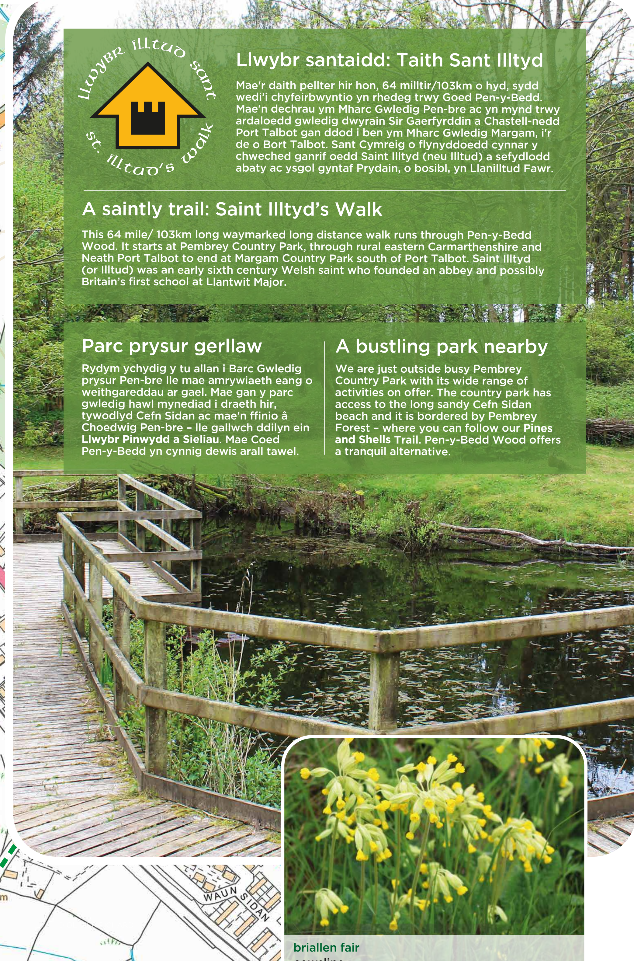
briallen fair cowslips

We are just outside busy Pembrey Country Park with its wide range of activities on offer. The country park has access to the long sandy Cefn Sidan beach and it is bordered by Pembrey Forest - where you can follow our Pines and Shells Trail. Pen-y-Bedd Wood offers a tranquil alternative.