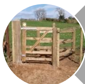
Photo: Gwella'r mynediad at Gae Chwarae Caeathro, Gwynedd

Gosod arwyddion a chyfeirbwyntiau, a giataiu sy'n cau eu hunain i ddisodli camfeydd;