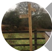
Photo: Gwarchodfa Natur Parc Slip, Pen-y-bont ar Ogwr

Gosod arwyddion gweledol a marcwyr hyder, a byrddau gwybodaeth ar lwybrau safleoedd;