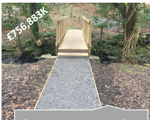
a) Gwelliannau ymarferol ar lawr gwlad