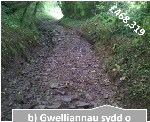
b) Gwelliannau sydd o fudd i fwy nag un grŵp o ddefnyddwyr