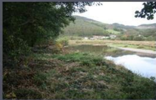
Left Bank of Mawddach - Sept 2012