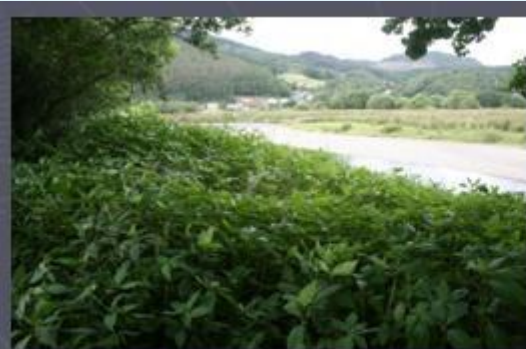
Left Bank of Mawddach - July 2012

Mae bygythiad parhaus o ardaloedd cyfagos nad ydynt wedi'u trin ac mae'r genweirwyr yn gwbl ymwybodol bod angen dull o ymdrin â'r dalgylch cyfan. Maent mewn cysylltiad ag eraill yn yr ardal e.e. mae CNC yn gweithio i glirio Clymog Japan yn rhan o gynllun lliniaru llifogydd Dolgellau ac mae wedi cysylltu â "Phrosiect Clymog Japan Eryri" a allai arwain at ragor o gydgyssylltu ar gyfer mapio strategaeth rheoli i'r dyfodol yn y parc cenedlaethol.