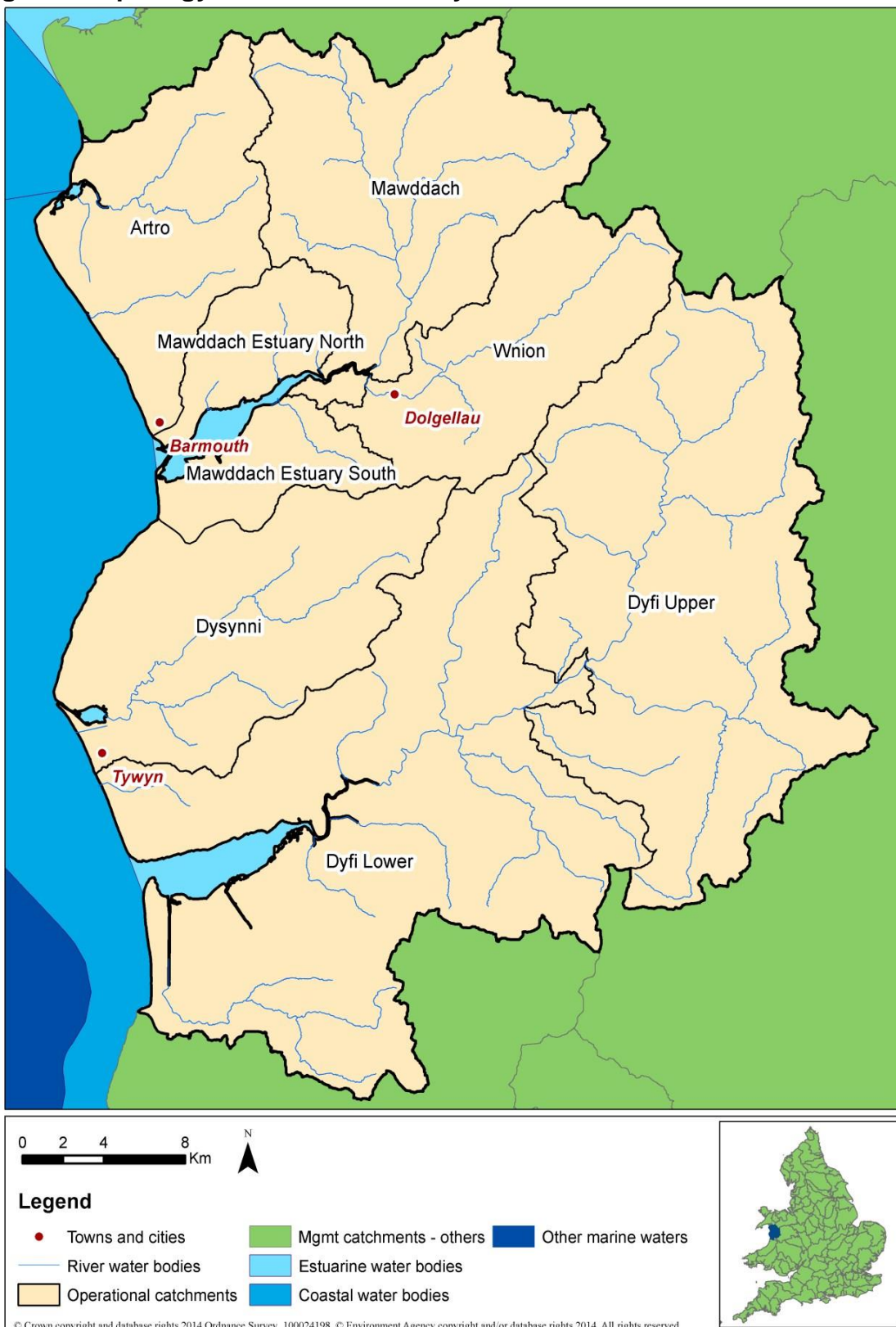
Ffigur 1. Map Dalgyrch Rheoli Meirionnydd