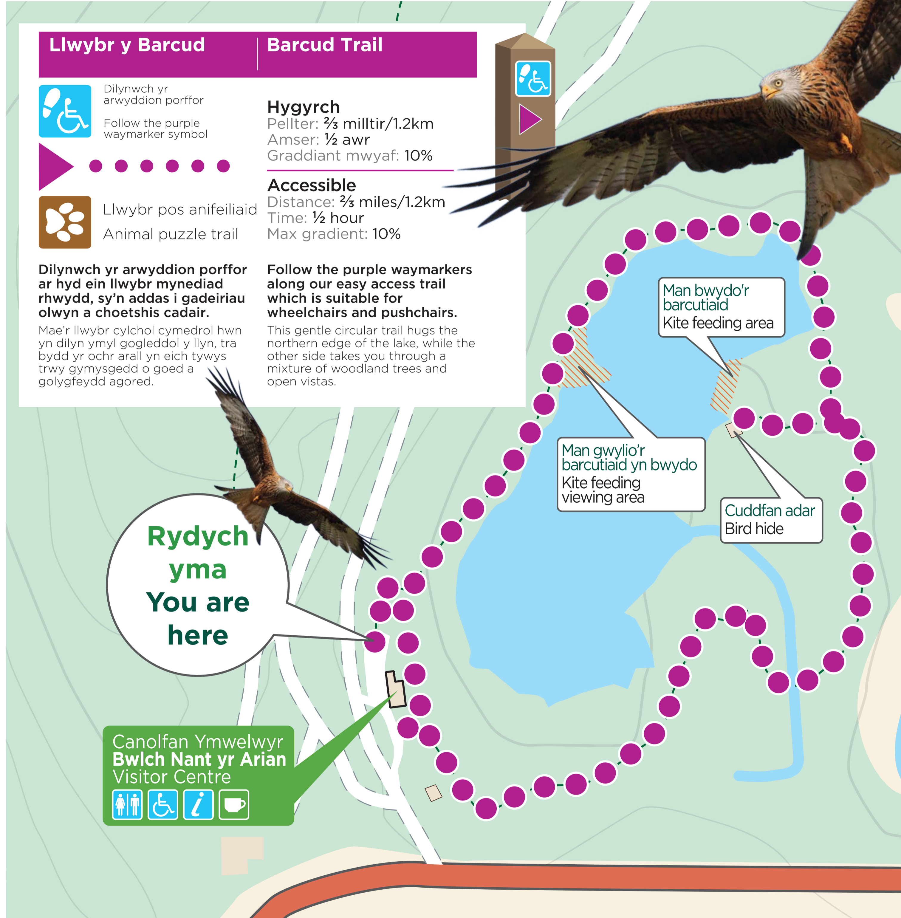
Atgynhychir y map hwn o Ddeunydd yr Arolwg Ordnans gyda chaniatâd Arolwg Ordnans ar ran Rheolwr Llyfrfa Ei Mawrhydi Hawlfraint y Goron. © Hawlfraint y Goron a hawliau cronfa ddata 2015 Arolwg Ordnans 100019741. 2015 This map is based upon Ordnance Survey material with the permission of Ordnance Survey on behalf of the controller of Her Majesty's Stationary Office © Crown copyright and database rights 2015 Ordnance Survey 100019741. 2015

This gentle circular trail hugs the northern edge of the lake, while the other side takes you through a mixture of woodland trees and open vistas.