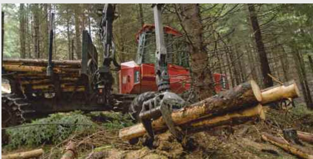
Nhabl 1: Lefelau Cynllun Marchnata Comisiwn Coedwigaeth Cymru, boncyffion gwerthadwy gan gynnwys prennau caled.

Gan ddibynnu ar alw'r farchnad, gall y swm gwirioneddol a gaiff ei gynaeafu a'i gyflenwi fod yn fwy neu'n llai mewn unrhyw flwyddyn.